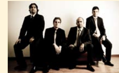
Quartetto di Cremona

Schumann Recital Castle of the Knights of Malta, Magione Angela Hewitt , piano Arabeske, Op. 18 Davidsbündlertänze, Op. 6 Waldszenen, Op. 82 Sonata in G minor, Op. 22