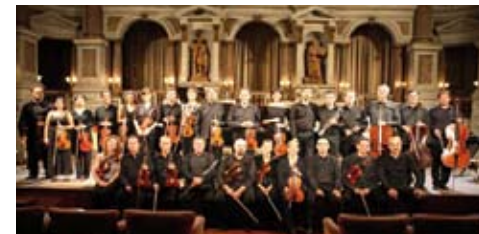
Orchestra da Camera di Mantova

Mozart: Concerto per pianoforte e orchestra in Re minore, K. 466