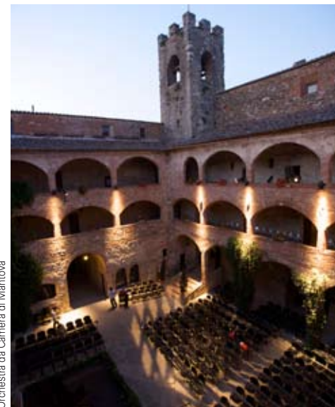
Castello dei Cavalieri di Malta, Magione - Castle of the Knights of Malta, Magione